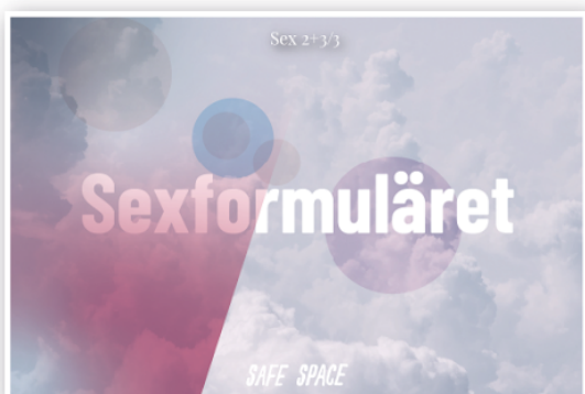
Kartläggning av intresse och erfarenheter