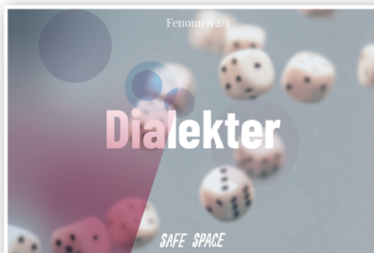
Dialektkamp som rastikiertely på zoom