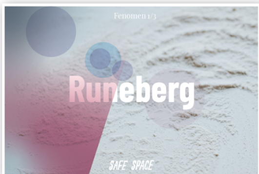
Dikt om Emma Grön & utlottning av runebergstårter