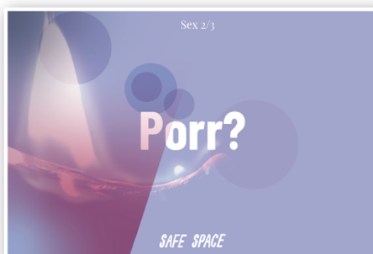
Diskussionsartikel om porrindustrin