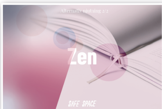
30-dagars challenge med halarmärke som belöning