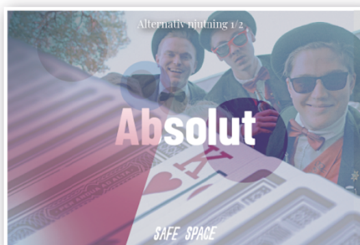
Pidrotturnering, mocktails och knallomskärning