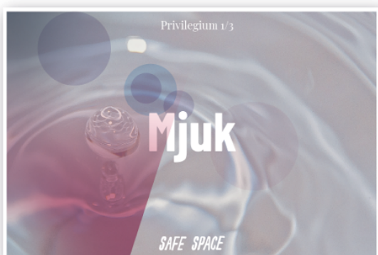
Vodcast och reportage i Modulen med Caroline Suinner